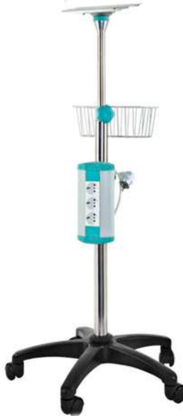
Код продукта: MG-MAR Описание продукта: Стойка для монитора