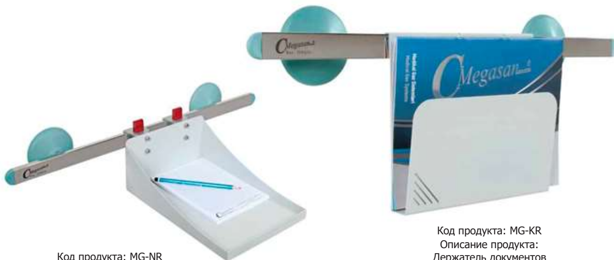
Код продукта: MG-NR Описание продукта: Полка для блокнота