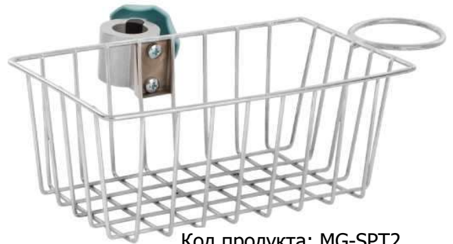
Код продукта: MG-SPT2 Описание продукта: Корзина для инструментов, модель 2 Размер: 25x15x10 см