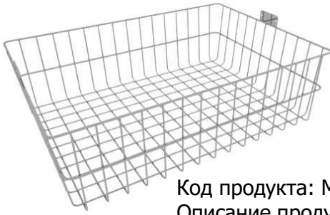
Код продукта: MG-SPT3 Описание продукта: Корзина для инструментов, модель 3 Размер: 40x55x15 см