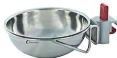
Код продукта: MG-TAS Описание продукта: чаша для сбора отходов- Clamp соединение