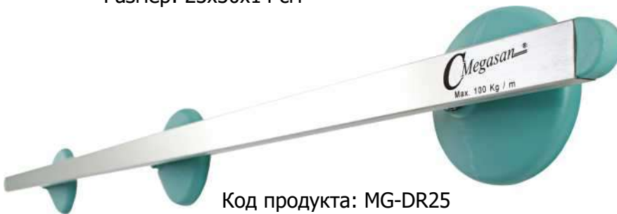
Код продукта: MG-DR25 Описание продукта: Настенный рельс 25x10