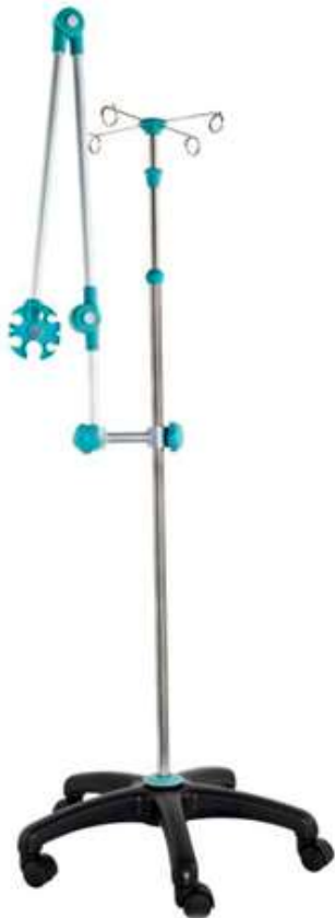
Код продукта: MG-SAR-HTY Описание продукта: Стойка с 4 кольцами, регулируемая по высоте с креплением шланга