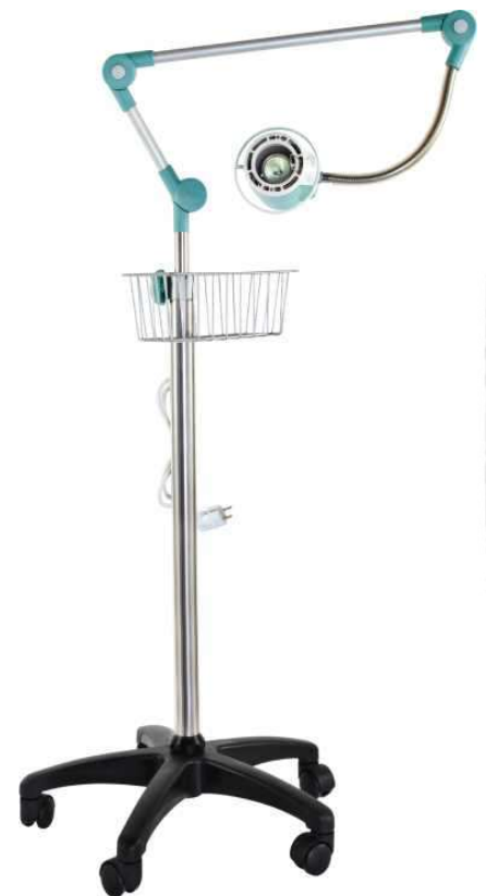
Код продукта: MG-LMA Описание продукта: Стойка с лампой на кронштейне и корзиной