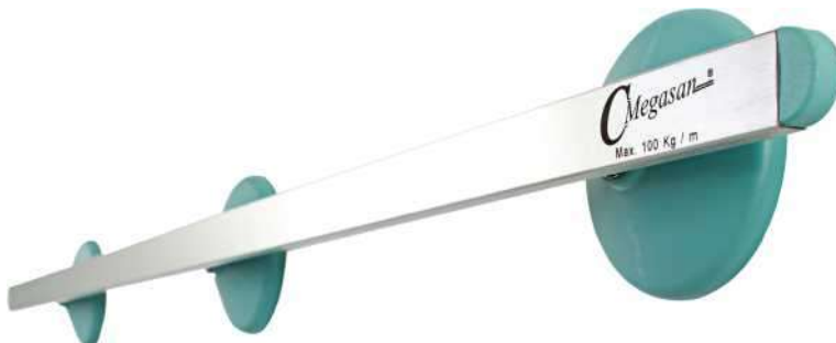
Код продукта: MG-DR30 Описание продукта: Настенный рельс 30x10