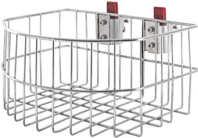
Код продукта: MG-SPT4 Описание продукта: Корзина для инструментов, модель 4 Размер: 23x30x14 см