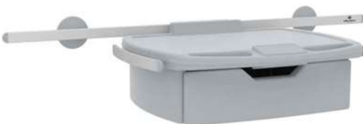
Код продукта: MG-MCR Описание продукта: Полка для монитора с ящиком – крепление на рельсе