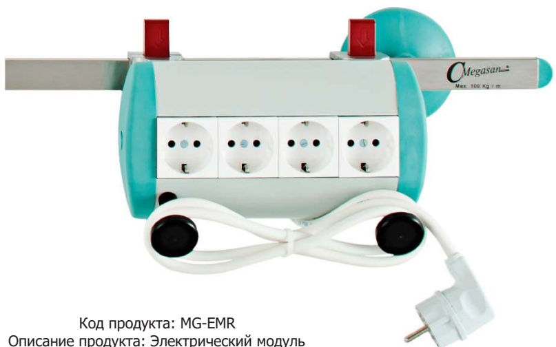
Код продукта: MG-EMR Описание продукта: Электрический модуль – крепление на рельсе