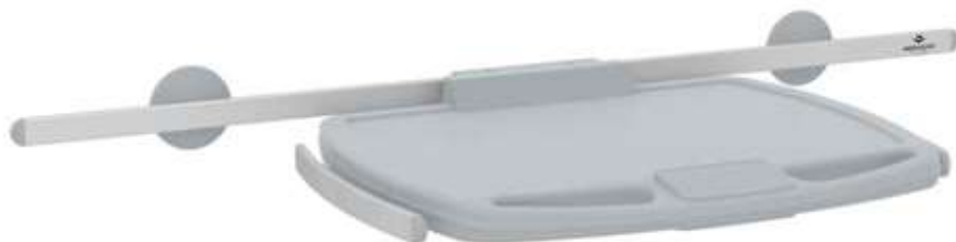
Код продукта: MG-MR Описание продукта: Полка для монитора