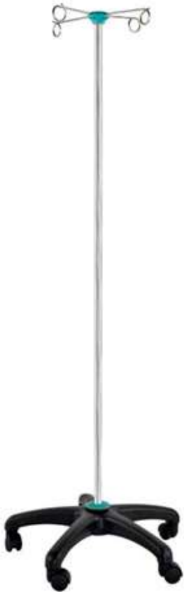
Код продукта: MG-SAR Описание продукта: Стойка с 4 кольцами