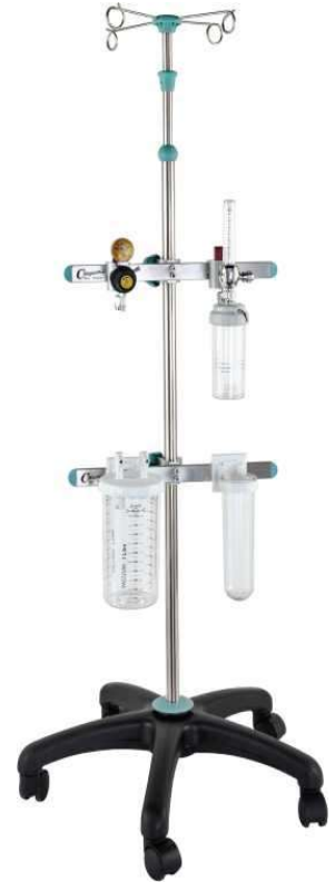
Код продукта: MG-SAR-RY Описание продукта: Стойка с 4 кольцами, регулируемая по высоте с 2 рельсами