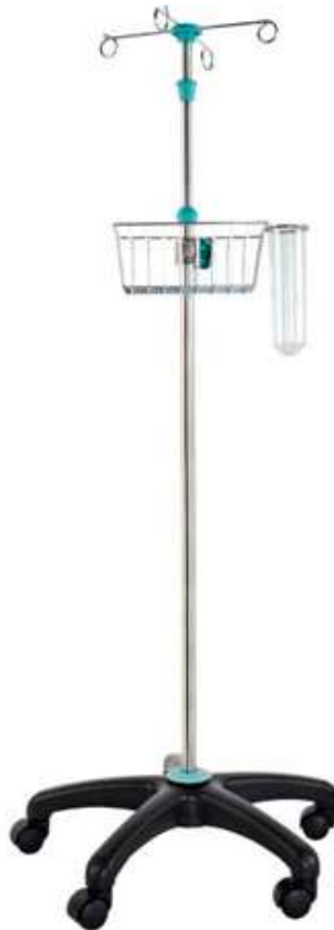
Код продукта: MG-SAR-SY Описание продукта: Стойка с 4 кольцами, регулируемая по высоте с корзиной